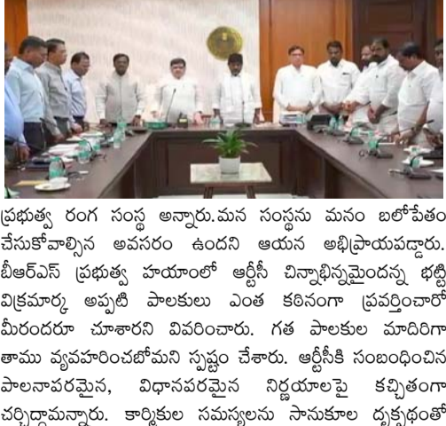
ప్రభుత్వ రంగం సంస్థ అన్నారు. మన సంస్థను మన బలోపేతం చేసుకోవాలని ఆవసరం ఉందని ఆయన అభిప్రాయపడ్డారు. బీఆర్ఎస్ ప్రభుత్వ హయాంలో ఆర్టీసీ చిన్నాభిన్నమైందన్న భట్టి విక్రమార్కు అప్పటి నేతలు ఎంత కఠినంగా ప్రయత్నించారో మీరందరూ చూశారని వివరించారు. గత పాలకుల మాదిరిగా తామే వ్యవహరించలేమని స్పష్టం చేశారు. ఆర్టీసీకి సంబంధించిన పాలనావరమైన, విధానపరమైన నిర్ణయాలపై కచ్చితంగా చర్చిద్దామన్నారు. కార్మికుల సమస్యలను సానుకూల దృక్పథంతో

మొదటివేళ తరువాయి - వారు డిప్యూటీ సీఎం భట్టి, మంత్రుల బృందాన్ని కలిశారు. రాష్ట్ర సచివాలయంలో మంత్రులు, ఆర్టీసీ జేపీసీ నేతల మధ్య చర్చలు కొనసాగుతున్నాయి. ఆర్టీసీ జేపీసీ నేతలు మొత్తం 32 డిమాండ్లను మంత్రుల ముందు ఉంచారు. 29 డిమాండ్లపై మంత్రుల బృందం సానుకూలంగా స్పందించింది. ఇప్పటికే 29 డిమాండ్లపై సానుకూలంగా ఉన్నామని పొన్నం ప్రభాకర్ ప్రకటించారు. మూడు కీలక డిమాండ్లపై మంత్రులు, జేపీసీ నేతలు చర్చిస్తున్నారు. ప్రభుత్వంలో విలీనం, కార్మిక సంఘాల గుర్తింపు, పీఆర్సీపై చర్యలు కొనసాగుతున్నాయి. ఆర్టీసీ డ్రైవర్ శంకర్ గౌడ్ ముఖి చాలా బాధాకరమని ఉపముఖ్యమంత్రి భట్టి విక్రమార్కు అన్నారు. ఇలాంటి విషాదకర సంఘటనలు పునరావృతం కాకుండా కార్మికులకు పిలుపునిచ్చామని తెలిపారు. కుర్చుని మాట్లాడుకుంటే ఖచ్చితంగా పరిష్కారం లభిస్తుందన్నారు. రాష్ట్ర సచివాలయంలో ఆర్టీసీ జేపీసీ నేతలతో జరిగిన చర్చల సందర్భంగా ఆయన మాట్లాడారు. ఆర్టీసీ నేతల మన రాష్ట్రంలోని అతిపెద్ద