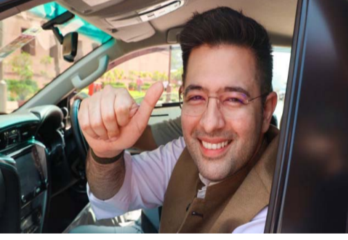
ఆందుకే పార్టీకి దూరమై ప్రజలకు దగ్గరవుతున్నాను" అని

మొదటివేళ తరువాయి - ఆమ్ ఆర్టీ పార్టీ (ఆర్టీ) ధార్మిక రాజకీయ ఎదురుదెబ్బ తగిలింది. పార్టీ వ్యవస్థాపక సభ్యుల్లో ఒకరు, కీలక నేత, రాజ్యభంగ సభ్యుడు రాఘవ్ చద్దా బీజేపీలో చేరనున్నట్లు సంచలన ప్రకటన చేశారు. తనతో పాటు మూడింట రెండుతలల వంటి ఆమ్ ఆర్టీ సభ్యులను కూడా బీజేపీలో విలీనం కానున్నారని చెప్పడం సంచలనం సృష్టించింది. ఢిల్లీలో సీనియర్ ఎంపీలు ఆరోక్ మిట్టల్, సందీప్ పాఠాకతో కలిసి నిర్వహించిన విలేజరుల సమావేశంలో రాఘవ్ చద్దా ఈ ప్రకటన చేశారు. ఈ సందర్భంగా ప్రధాన మాట్లాడుతూ, "15 ఏళ్లుగా ఆమ్ కు అంకితభంతో పనిచేశాను. కానీ ఒకప్పుడు అవినీతి నిర్మూలన నినాదంలో అధికారంలోకి వచ్చిన పార్టీ ఇప్పుడు నిజాయితీ రాజకీయాలకు దూరమైంది. నేను సరైన వ్యక్తి, కానీ తప్పుడు పార్టీలో ఉన్నాను."