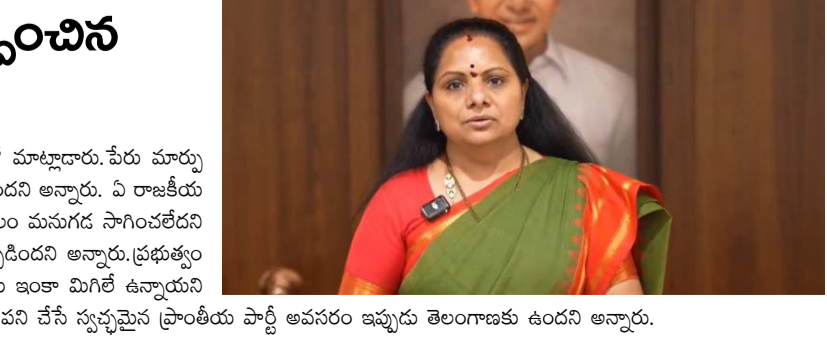
అన్నారు. వీరిని సాధించడమే మానా ప్రారంభించబోయే పార్టీ ప్రధాన ఉద్దేశమని అన్నారు. ప్రజల కోసం పని చేసే స్వచ్ఛమైన ప్రాంతీయ పార్టీ అవసరం ఇప్పుడు తెలంగాణకు ఉందని అన్నారు.

మొదటివేళ తరువాయి - నేడు కొత్త రాజకీయ పార్టీని ప్రకటించనున్న నేపథ్యంలో ఆమె మీడియాతో మాట్లాడారు. పేరు మార్పు మొదలు ప్రతి విషయంలో బీఆర్ఎస్ మారందని, దీనితో ఆ పార్టీకి ప్రజలతో ఉన్న పేగుబంధం తెగిపోయిందని అన్నారు. ఏ రాజకీయ పార్టీ అయినా తన ప్రాథమిక ఉద్దేశం, మూల సిద్ధాంతం నుంచి పక్కకు తప్పుకుంటే ఆ పార్టీ ఎక్కువ కాలం మనుగడ సాగించలేదని అన్నారు. బీఆర్ఎస్ తన ప్రాథమిక ఉద్దేశం నుంచి పక్కకు తప్పుకోవడం వల్ల ఆ పార్టీకి ఈ పరిస్థితి ఏర్పడిందని అన్నారు. ప్రభుత్వం మానా తెలంగాణలో ఎన్నో సమస్యలు ఉన్నాయని ఆందోళన వ్యక్తం చేశారు. తెలంగాణ ప్రజల అంక్షలు ఇంకా మిగిలే ఉన్నాయని అన్నారు. వీరిని సాధించడమే మానా ప్రారంభించబోయే పార్టీ ప్రధాన ఉద్దేశమని అన్నారు. ప్రజల కోసం పని చేసే స్వచ్ఛమైన ప్రాంతీయ పార్టీ అవసరం ఇప్పుడు తెలంగాణకు ఉందని అన్నారు.